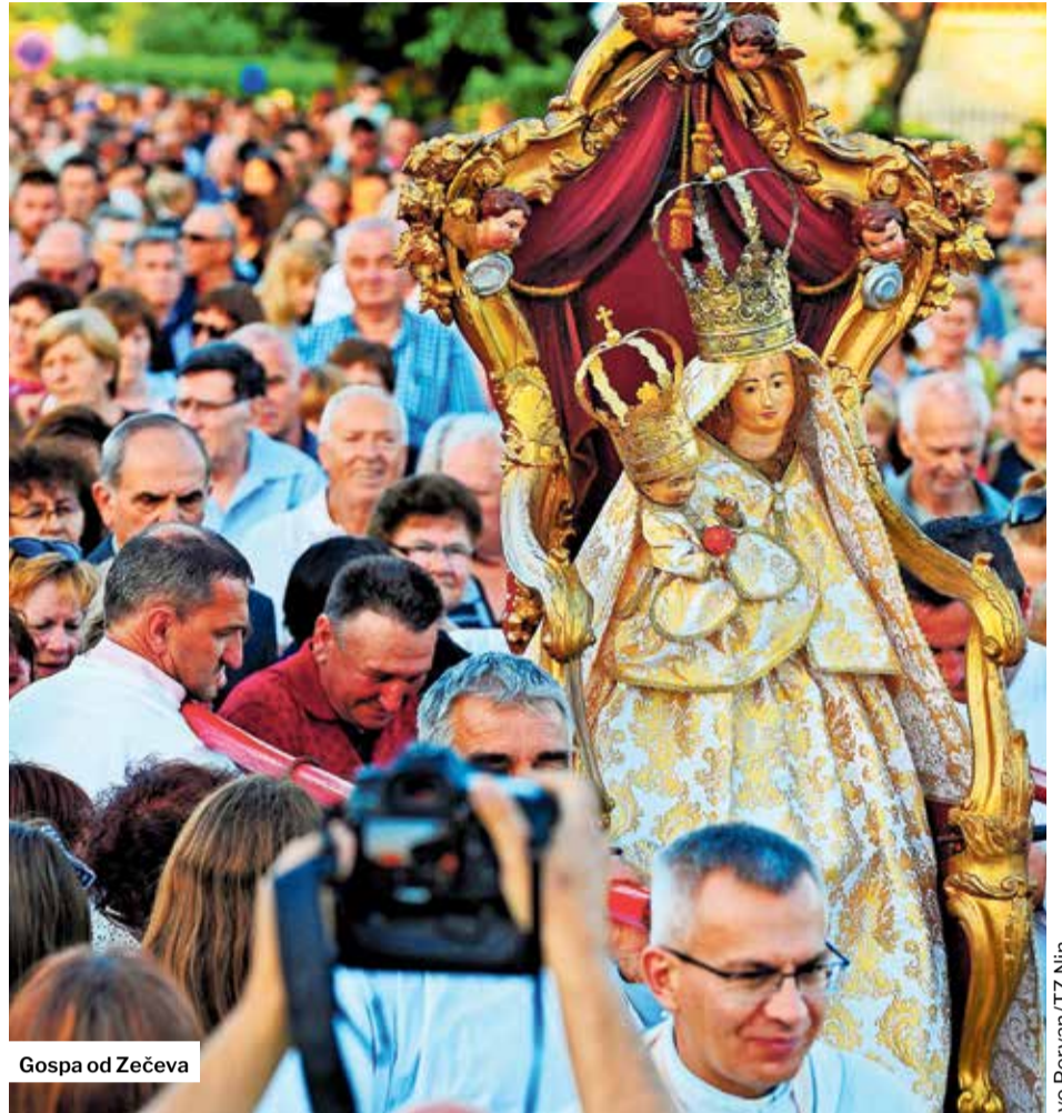
Gospa od Zečeva