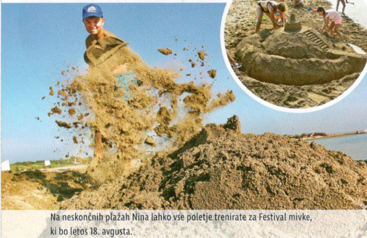
Na neskončnih plažah Nina lahko vse poletje trenirate za Festival mivke, ki bo letos 18. avgusta.