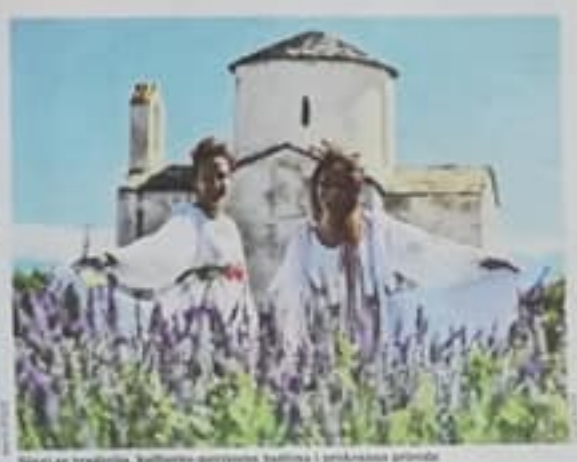
Stari sa tvrđava, kulturno-gospodarska baština i prirodna priroda

Uz obnovu i rekonstrukciju Edo Nin privlači dragi ulaz - jedna od najpoznatijih turističkih atrakcija