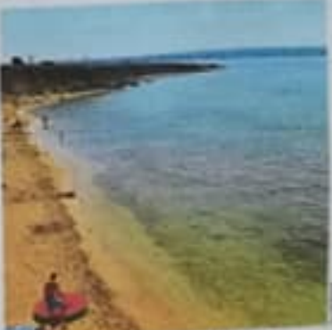
Julianova plaža, jedna od najpoznatijih turističkih atrakcija

Uz obnovu i rekonstrukciju Edo Nin privlači dragi ulaz - jedna od najpoznatijih turističkih atrakcija