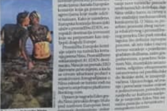
Čak se u Edo Ninu