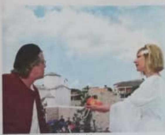
Na obitelji posetnici i ljudi sa kulturno dragulje