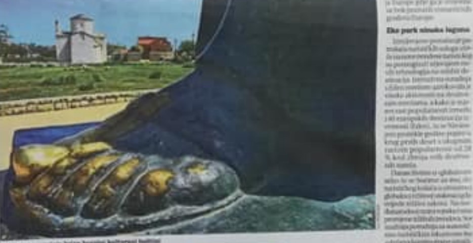
U Ninu se promovira brend leguma kulturno baština

Uz obnovu i rekonstrukciju Edo Nin privlači dragi ulaz - jedna od najpoznatijih turističkih atrakcija