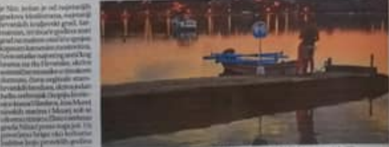
Uz obnovu i rekonstrukciju Edo Nin privlači dragi ulaz - jedna od najpoznatijih turističkih atrakcija