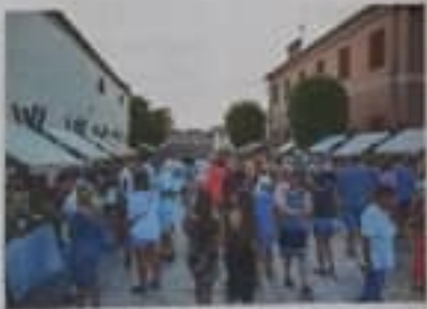
Tržišnica. Turistički aspekt ulice grada